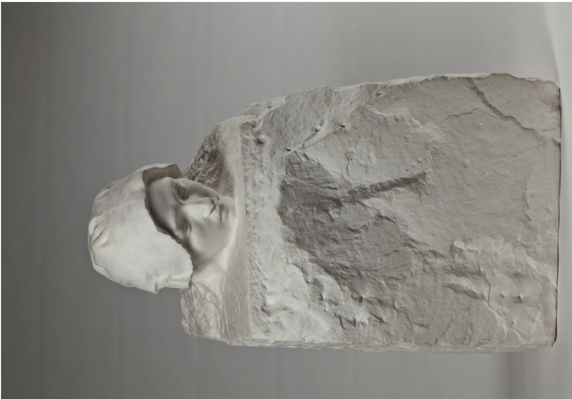
Auguste RODIN, La Pensée, 1893-1895, plâtre, H : 71,2 cm ; L : 42,1 cm ; P : 45,1 cm, Paris, Musée Rodin.