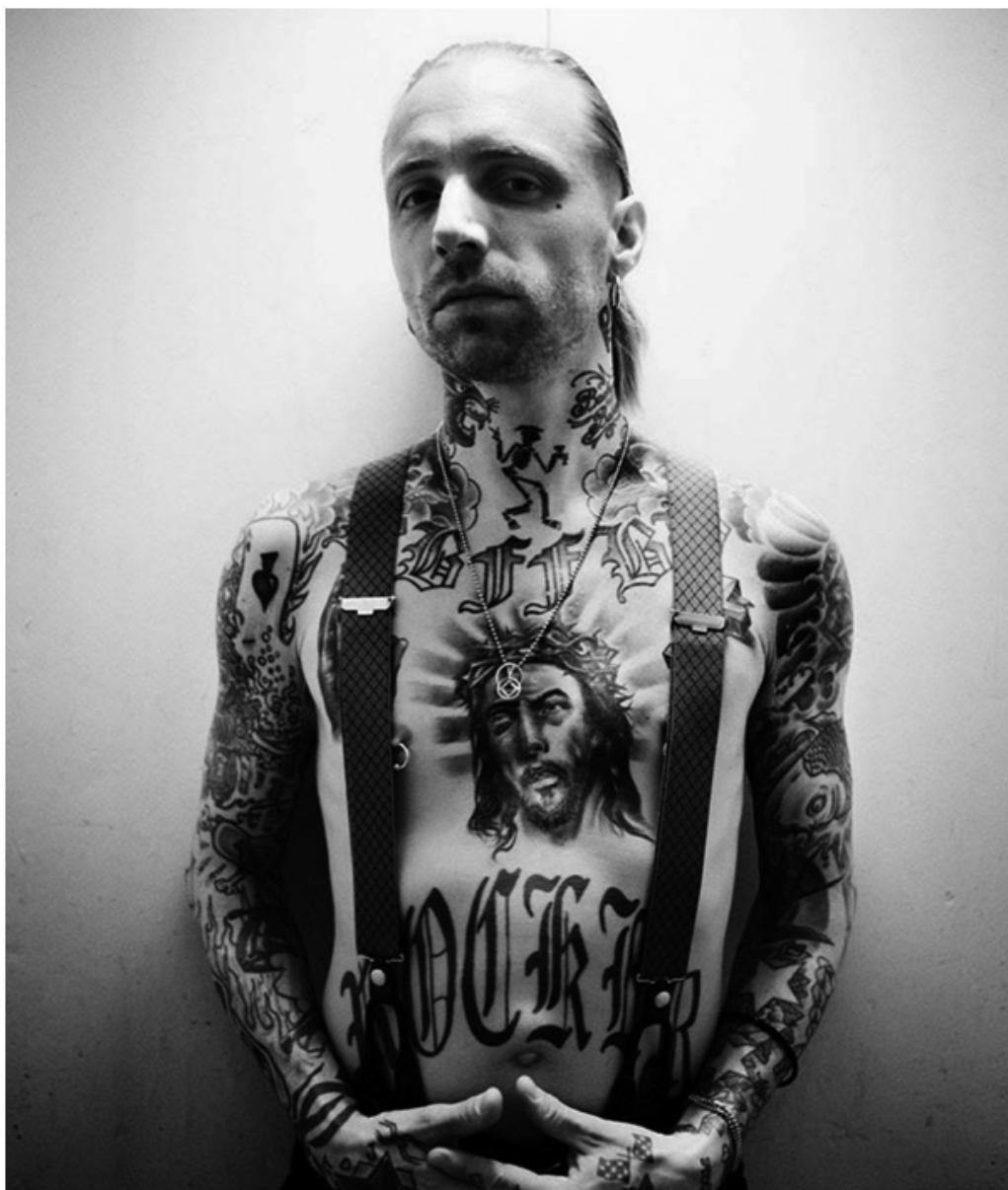
Julien Lachaussée, Nicke Borg / Backyard Babies , 2010, photographie argentique du chanteur-bassiste du groupe de hard rock Backyard Babies, 150 x 120 cm.