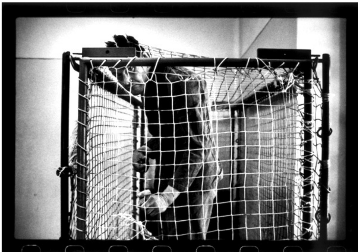
Raymond Depardon, Hôpital psychiatrique de San Clemente, Italie, 1979 , photographie argentique, publiée dans San Clemente , éditions du Centre National de la photographie, collection Photo Copies, 1984.