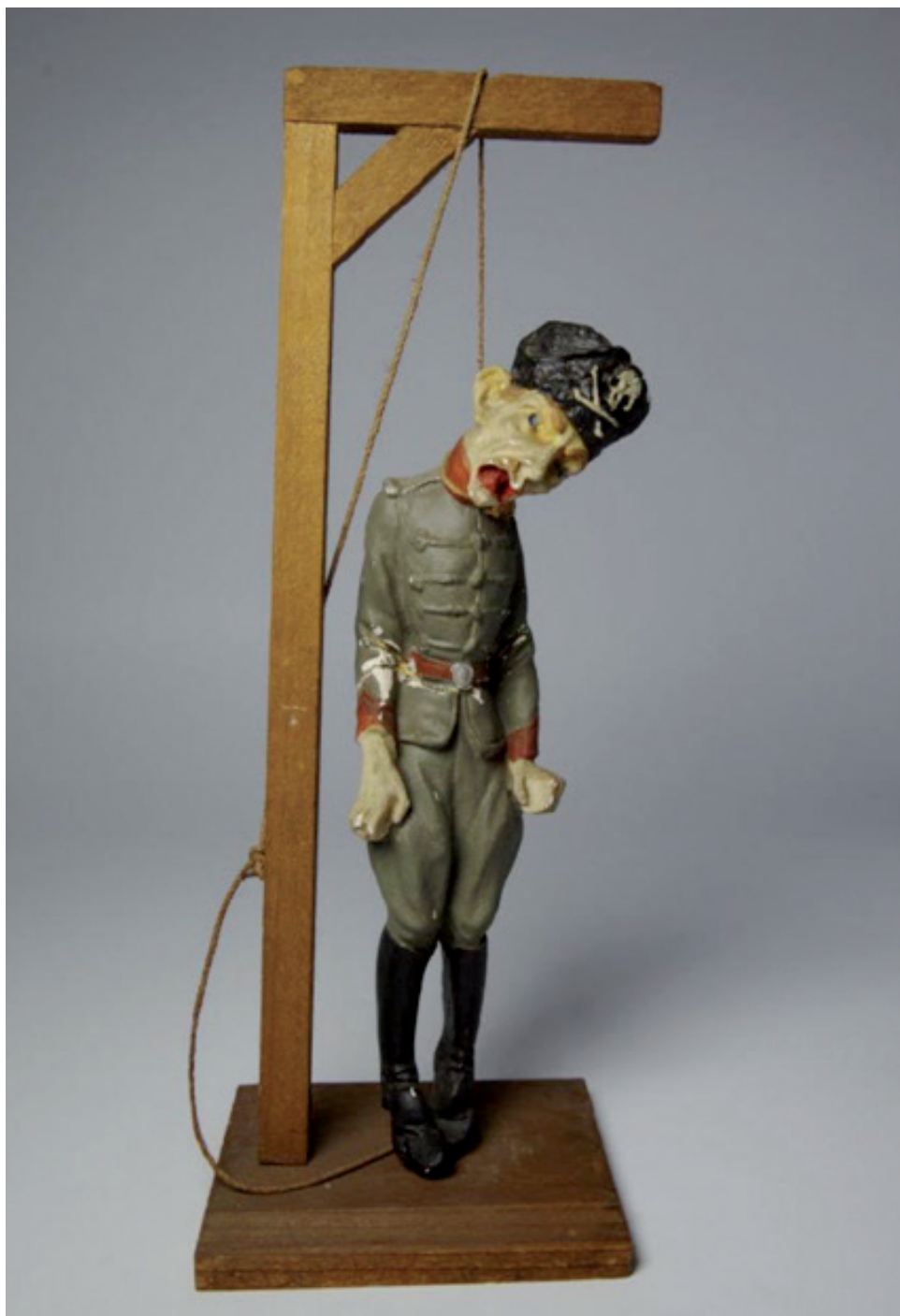
Soldat allemand pendu , 4 e quart du XIX e siècle, plâtre, bois, corde, fer, 31,3 x 12,5 x 10 cm, Musée d'Orbigny-Bernon, La Rochelle.